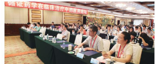
■“循证药学在临床治疗中的应用”会议圆满落幕。

2015年11月7日,由厦门市海沧医院主办、厦门市医学会协办的国家级继续教育讲座在厦门宾馆举行,本次讲座的主题为“循证药学在临床治疗中的应用”,200余名来自省内各大医院的药师、医师、护士参加了此次会议。