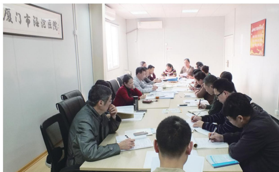
院党政领导班子及职能科室负责人、党群部门负责人共同参加学习

姜燕院长要求,“三严三实”教育活动是党的群众路线教育实践活动的延展深化,是持续深入推进党的思想政治建设和作风建设的重要举措。与会要注重坚持加强学习,自觉