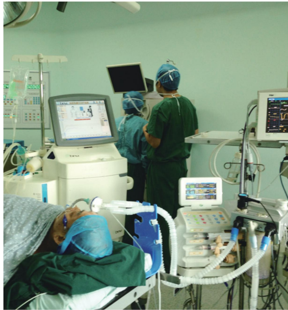
▲患者正接受体腔热灌注治疗。

“我们院引进的体腔热灌注治疗系统,是目前较为先进的设备,使用安全、疗效确切。”陈毅德介绍,该仪器将化疗药物与大容量灌注液混合加热到43℃,持续循环恒温灌注入患者胸