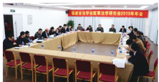
■相关领导及专家出席本次年会

2015年12月26日,福建省法学会医事法学研究会2015年年会在厦门市海沧区召开。本次年会由福建省法学会医事法学研究会主办,由厦门市海沧区卫计局、厦门市海沧医院共同承办。省法学会姚国祥秘书长、省、市卫计委领导以及近40名省内法学界、医学界专家学者,包括多位医学-法律跨学科专家出席本次年会。