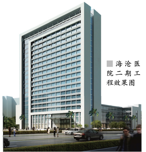
海沧医院二期工程效果图

2003年,非典爆发,由于在呼吸内科有着绝对的优势,海沧医院成为了厦门唯一一家收治非典隔离病人的医院。姜院长说起这事就很自豪:我们当时很紧张,因为没有病房嘛,就临时装修急诊科那层楼,大概48小时内就完成隔离病区的布置,然后当时第一医院的病人马上就转了过来,接下来又陆续接收