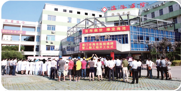
■ 厦门市海沧医院揭牌暨二期开工