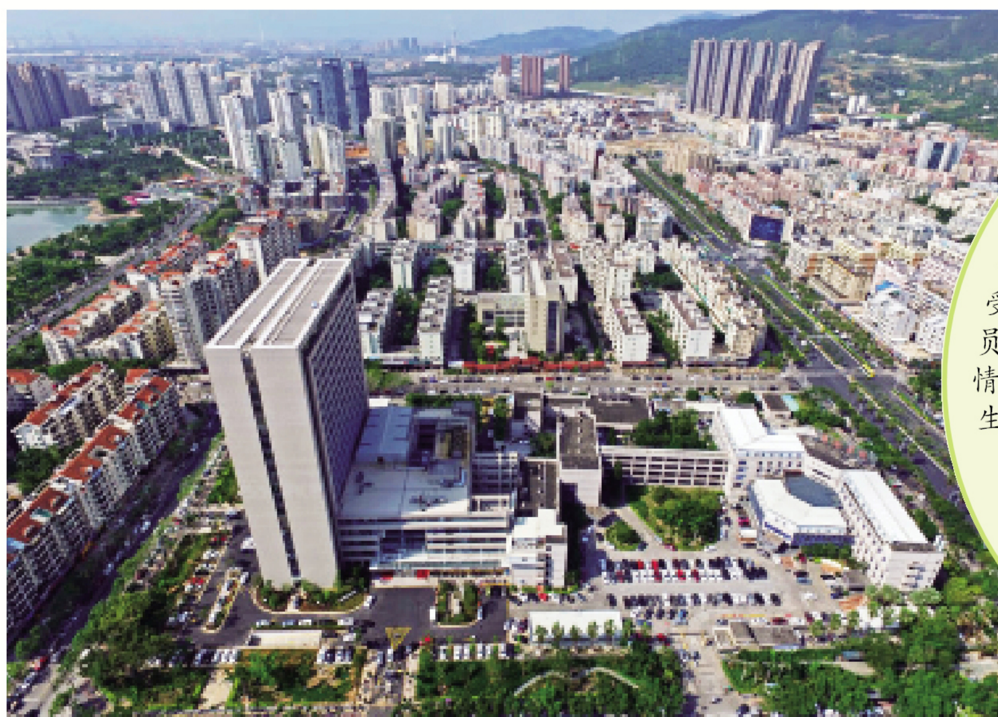
市海沧医院全景照。