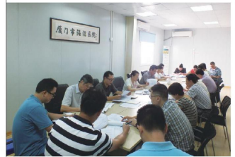
■我院开展安全生产专项整治活动。

为切实加强安全生产工作，深刻吸取天津港“8·12”瑞海公司危险品仓库特大火灾爆炸事故的教训，2015年8月17日、8月24日上午，我院在门诊部六楼第一会议室连续召开了安全生产工作部署会议，领导班子成员及职能科室负责人参加了会议。会上传达了习近平总书记关于切实做好安全生产工作的重要指示、李克强总理关于要求开展各类隐患排查的批示以及国务院安委会全体会议精神。