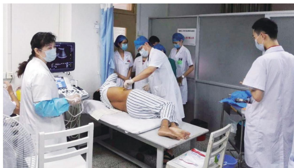
■我院完成近年首例经皮肝穿刺活检术。

有实时、准确、可多角度引导等特点，穿刺成功率高，安全性好，并发症少，特别对于触诊困难、深在的肝脏肿瘤以及在多病灶、小病灶情况下，超声引导优势更为明显。