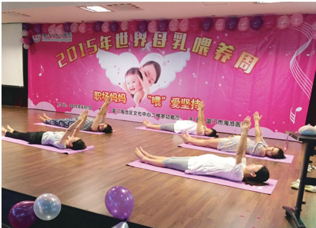
■我院开展2015年世界母乳喂养周公益活动。

8月1日至7日，又一个满载爱意的世界母乳喂养周即将到来，今年的主题是“职场妈妈，‘喂’爱坚持”。